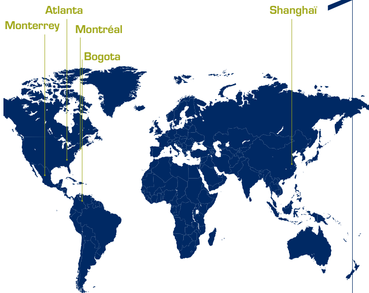
> Double-diplômes et transferts de crédits

Le projet en contexte international, mené de pair avec des élèves de l'Université de Lund (Suède) ou de Tec de Monterrey (Mexique), constitue une première occasion de développer ses compétences en milieu interculturel. L'élève de l'option AII réalise un stage de trois mois dans une entreprise ou un laboratoire de recherche à l'étranger, voire suit une année complète dans une université étrangère en transferts de crédits ou en double-diplôme.